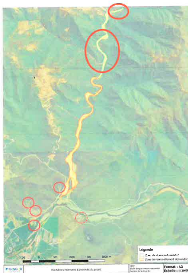
Extrait de notre dossier d'autorisation (Extension autorisée en zone NP entourée en rouge)

Sur ce point donc, nous avons besoin de nous assurer de la compatibilité du futur PUD de la commune avec notre activité, la fourniture de produits essentiels au secteur de la construction et la pérennité d'une entreprise de sept salariés et bon nombre de sous-traitants, notamment rouleurs, sont en jeu :